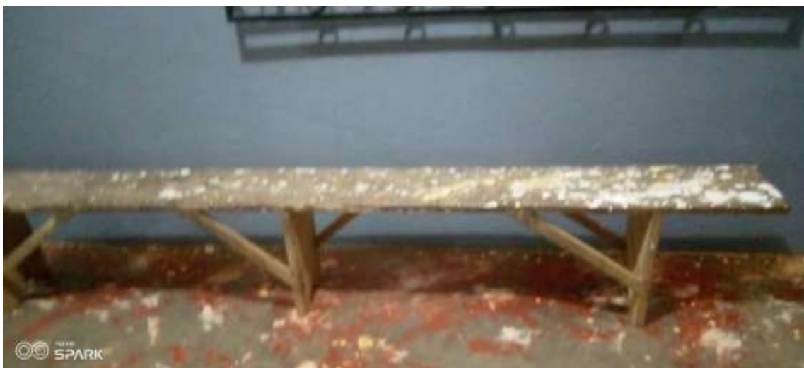
15: Bureau et salle d'hospitalisation au CMA de Makenéné

Ces images démontrent en majeure partie la réalisation pas complète des projets et le manque d'entretien de ceux-ci par les prestataires et par la Commune. Les responsables de la Mairie pourraient si possible de se créer des équipes de relais et de suivi pour s'assurer de la bonne réalisation des travaux dans les différentes localités de la Commune.