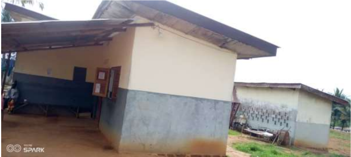
4: La pharmacie