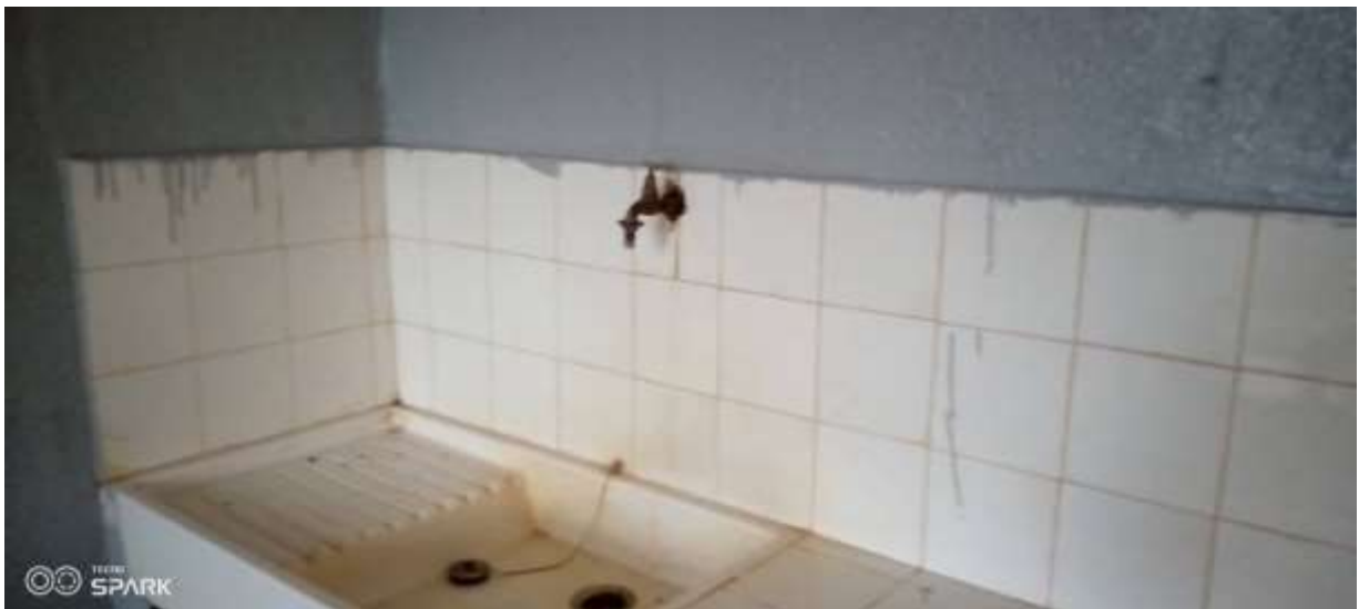
5: La salle d'accueil