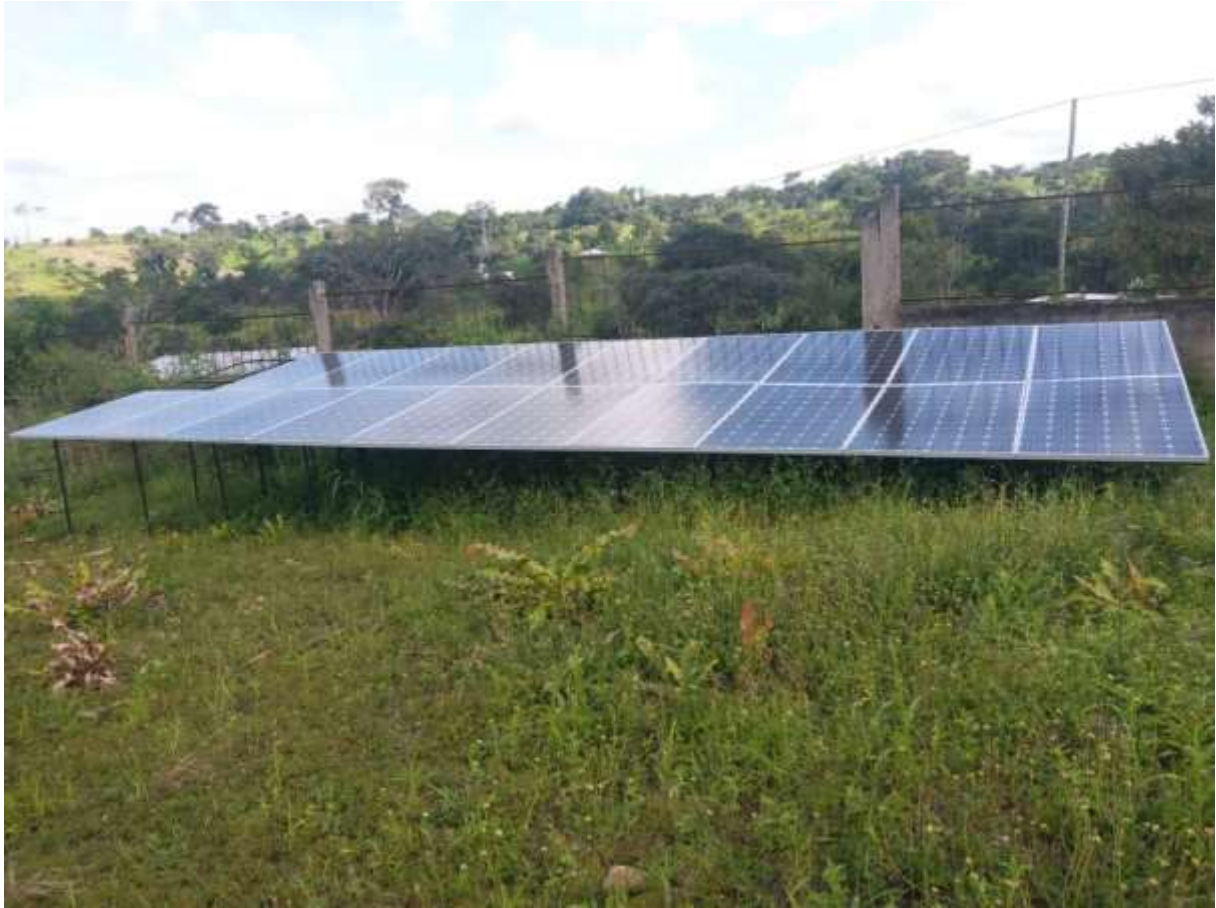
8: Pose des panneaux solaires du CSI de Kinding Djabi