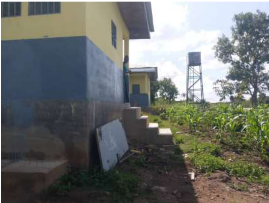
9: Réhabilitation du Centre de Santé intégré de Kinding Djabi