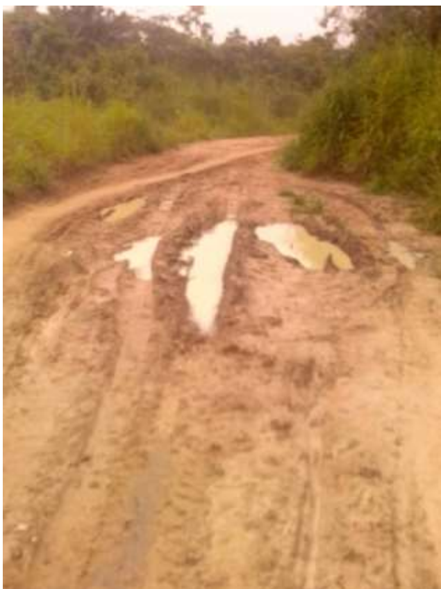
14: Flaque d'eau présente sur la route