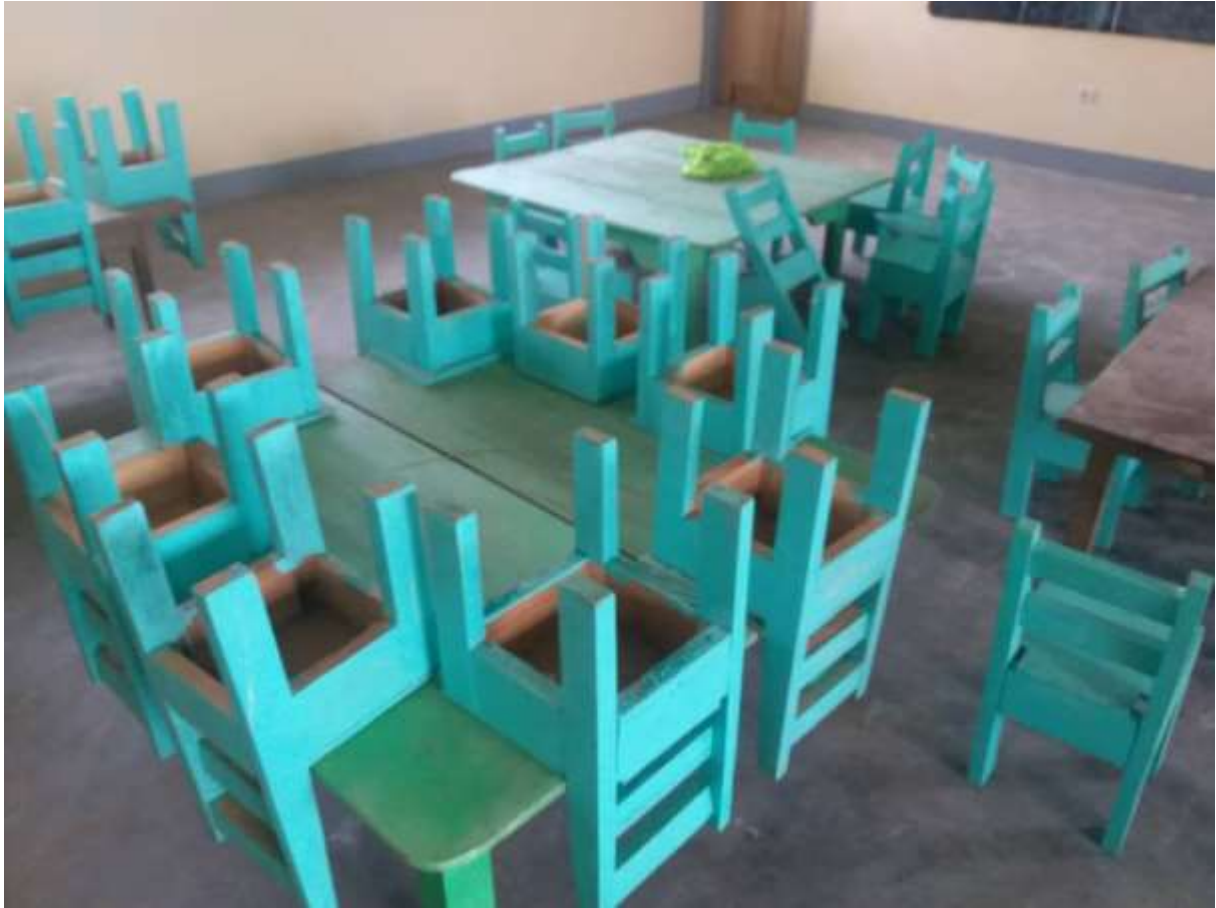
7: Equipement en 25 tables bancs à l'EM de Kinding Djabi