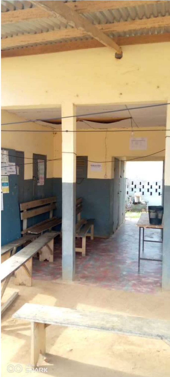
6: L'espace vaccination de routine