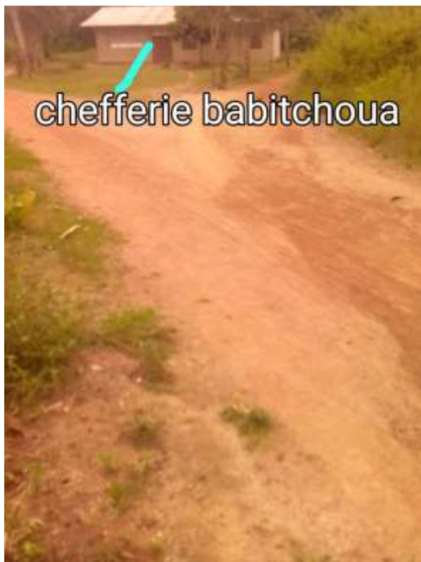
13: Fin du tronçon Mbang Babitchoua chefferie babitchoua