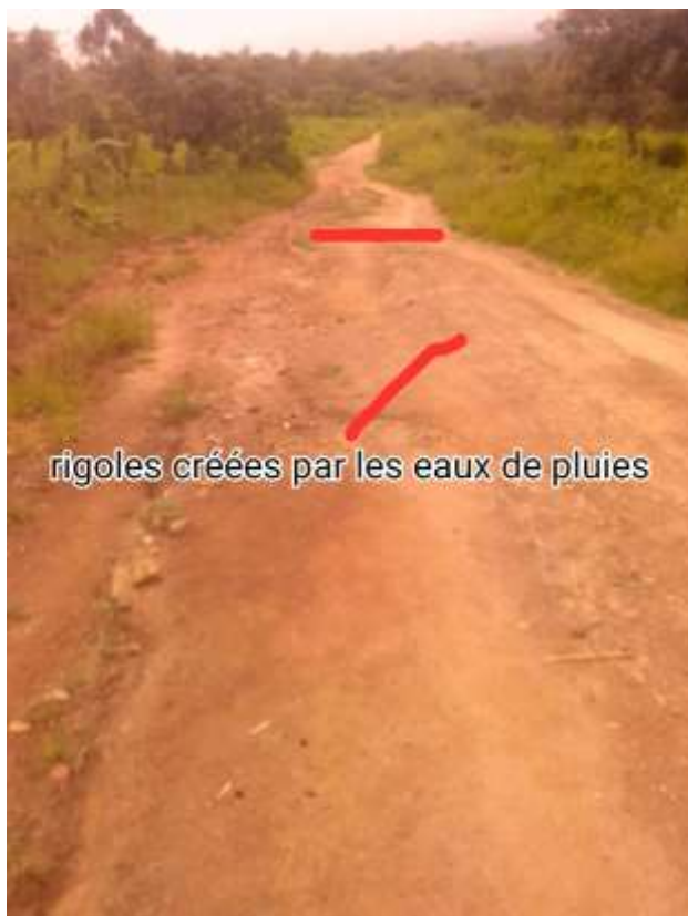
12: Par manque de caniveaux les eaux sont obligées de se créer un chemin