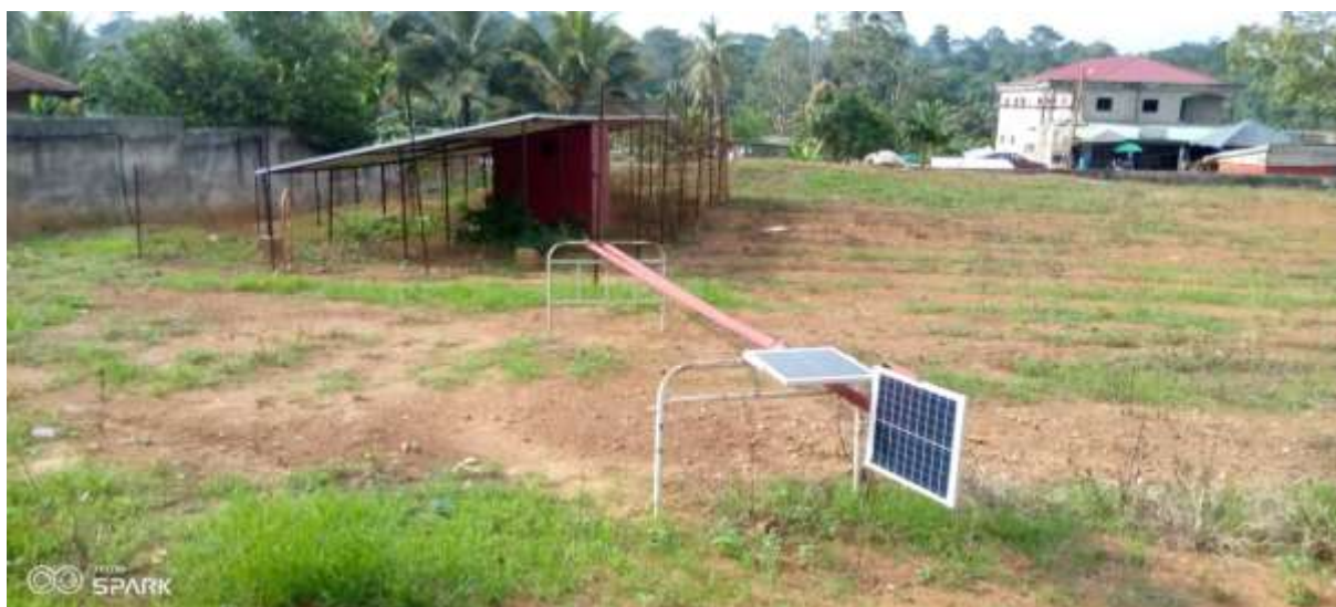
2 : Projet d'électrification du CMA de Makenéné