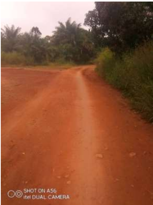
11: Début du tronçon Mbang Babitchoua Chefferie