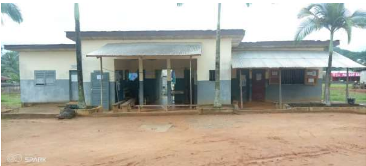
3: Réhabilitation du CMA de Makenéné