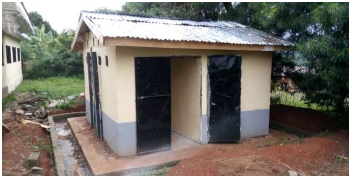
1 : Bloc latrine à 4 compartiments à l'EP Kinding Ndjabi

Ci-dessous quelques photos illustratives des projets prises sur le terrain :