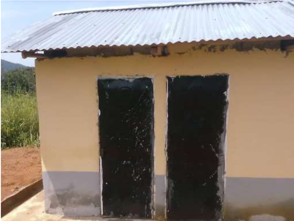
10: Bloc à 4 latrines à EP de Klinding Djabi